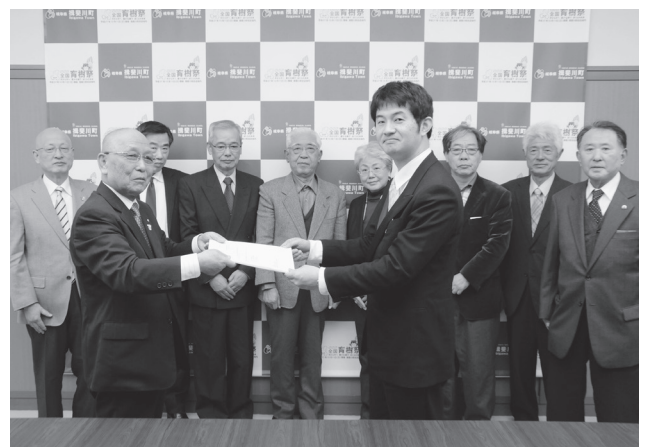
【地域福祉計画案答申の様子】

◎計画書は、町のホームページでご覧いただけます。計画書の冊子は、役場、各振興事務所、各公民館に配布してあります。 【問合せ先】 役場福祉課 (☎22-2111)