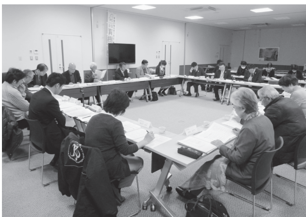
【地域福祉計画策定委員会の様子】

計画の「概要版」を広報いびがわ5月号と合わせて、町内全戸に配布していますので、ぜひ、ご覧ください。