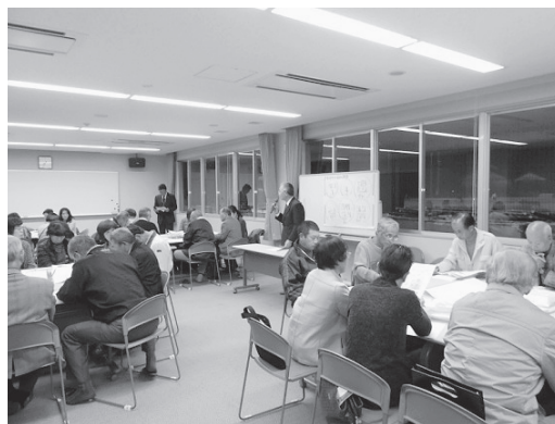
【地域福祉懇談会の様子】