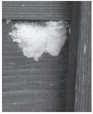
マイマイガの卵塊 (らんかい)