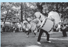
最優秀賞「木漏れ日の中」