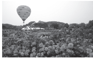
世界のバラ園と気球

世界最大級のバラ園を有する花フェスタ記念公園では、「花で育む 清流の国ぎふ」をテーマに、春のバラの時期に合わせて、「花フェスタ2015ぎふ」を開催します。「美しく、美味しい祭典」をお楽しみください。