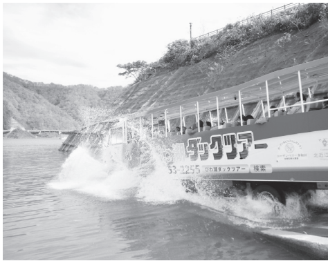
徳山湖上を走る水陸両用バス