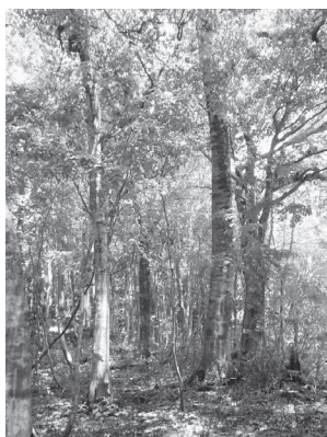
緑が美しいブナ林

◆ブナ自然林観察後、逆の行程で中央公民館へ帰ります。(帰りは、徳山ダム見学はありません)