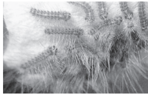
マイマイガの幼虫

外壁や窓にマイマイガが留まっている場合は、ガ専用のエアゾール殺虫剤を使用することも効果が得られます。