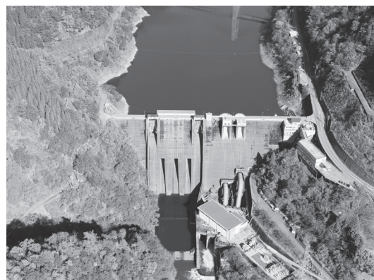
上空から見た横山ダム