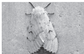
マイマイガの成虫