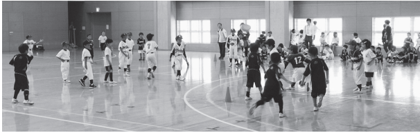
ドッジビー競技のようす