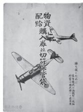
物資配給購入券切符保管袋