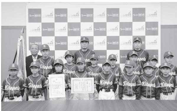
北方野球スポーツ少年団