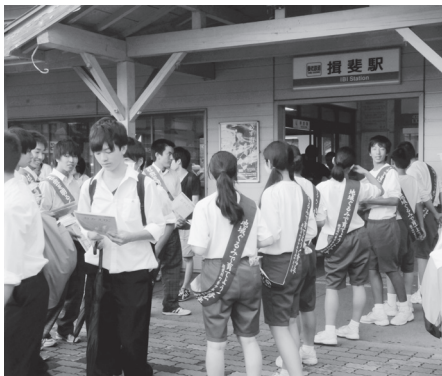
啓発活動を行う学生たち

私たち住民一人ひとりが、犯罪や非行の防止と、罪を犯した人たちの更生について理解を深め、それぞれの立場において力を合わせ、犯罪や非行のない地域社会を築いていきたいと思います。