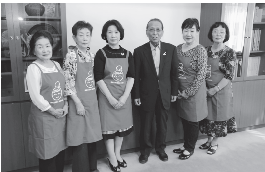
揖斐川町商工会女性部の皆さん