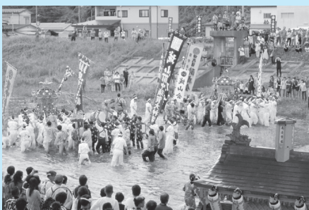
小鉤川に入る神輿

大槌町社会福祉協議会では、この大槌まつりに合わせ、町外に避難している住民を対象に「大槌まつりで会いましょう」のバスツアーを企画し、それに合わせて岩手県による参加者に、町内の復興状況を見学する会を開催しました。昨年のまつりの時期には無かった盛土工事を目の当たりにし、その変わりゆく大槌町を見ながら、参加者は数年後の町の姿を思い浮かべたことでしょう。