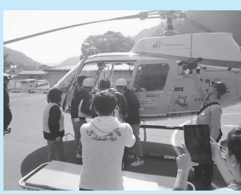
ヘリコプターによる救助訓練

建設が進む県営災害公営住宅の内、3棟150戸への入居が11月から始まりました。被災された方にとっては待ちに待った住宅ではありますが、その周辺自治会では不安が広がっています。120戸程の自治会にそれを上回る世帯数の入居が始まるため、今後の住民同士の交流をいかに進めるか、また多くの高齢者の入居も見込まれ、その見守りをどうするか議論は、まだ始まったばかりです。