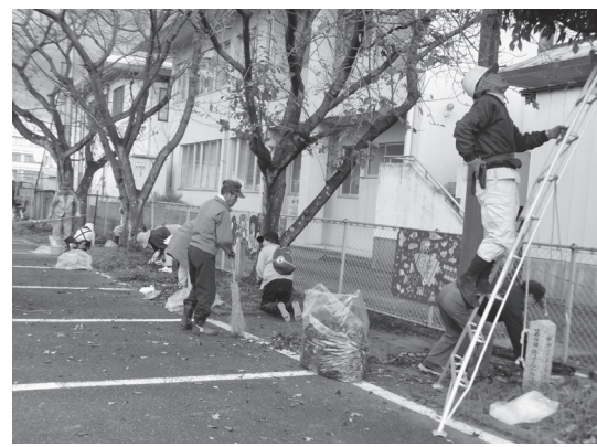
ボランティア清掃の様子

いびがわマラソンに来町されたランナーの方などに、施設を気持ちよく利用していただけるよう、毎年マラソン前に実施しています。会員約100名が参加し、草取りや木の剪定を行いました。作業終了後には会員自慢の野菜を入れた豚汁をいただき、会員同士の交流を図りました。