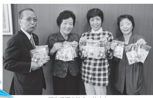
更生保護女性会の皆さん