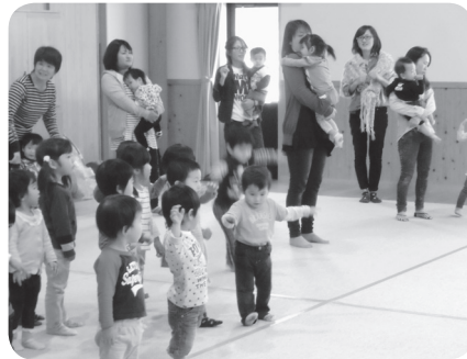
あか組さんと一緒にリズム遊びやサーキットごっこを楽しみました。 【11月11日 おじま幼児園】