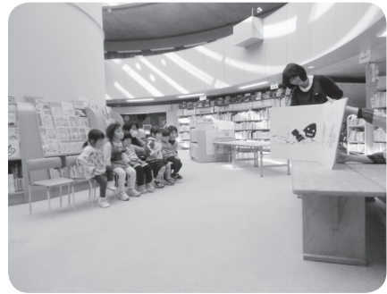
紅葉を見ながら散歩を楽しみ、図書館で大型絵本を見てからパン屋さんで買い物をしました。 【11月4日 谷汲図書館】