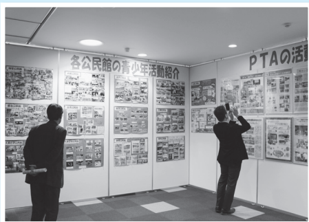
ロビーには各地区公民館・各小中学校 PTAの活動パネルなどが展示されました。