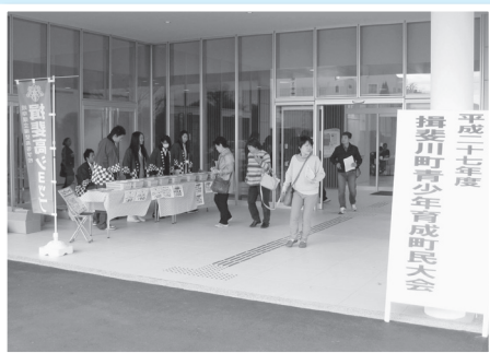
揖斐高ショップが開設されました。