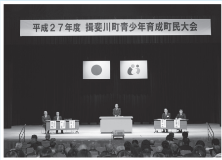
宗宮町長のあいさつ