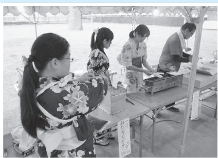
高校生ボランティアも参加しています。

青少年の健全な育成を願い、揖斐川町青少年育成町民会議主催による、「平成27年度揖斐川町青少年育成町民大会」が11月21日(土) 揖斐川町地域交流センターで開催されました。 この大会は、5月に行われた「町民会議総会」で掲げた活動目標についての成果発表を報告するために、毎年開催しています。揖斐高校の二人の生徒による司会で、当日は3部会の活動発表のほかに、各種表彰や、ラジオ体操の取り組みの発表、小学生県外派遣(北海道芽室町・高知県宿毛市)の報告が行われました。また、各地区公民館活動、各小中学校PTA活動のパネルなどの展示があり、訪れた人の目を楽しませていました。