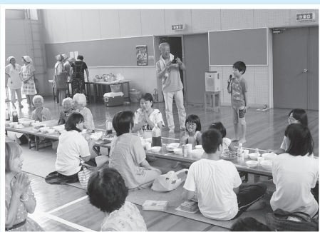
イベントで自己紹介の場をもうけました。