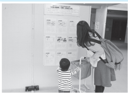
町内各施設に「わが家の家族時間」の作品を展示 しました。