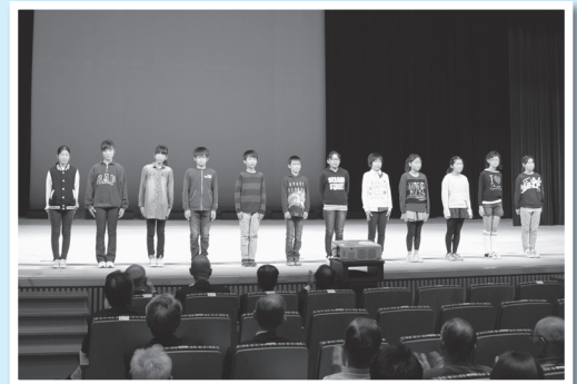
小学生県外派遣 (北海道芽室町) の報告