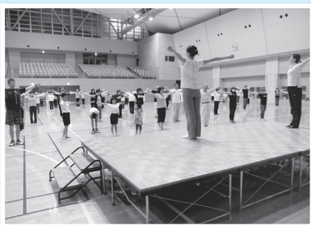
ラジオ体操指導者講習会を行いました。