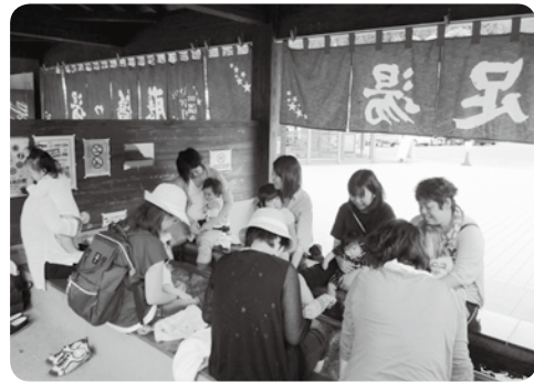
足湯に入って、親子でリラックス 会話も弾みました 【5月17日 藤橋温泉】