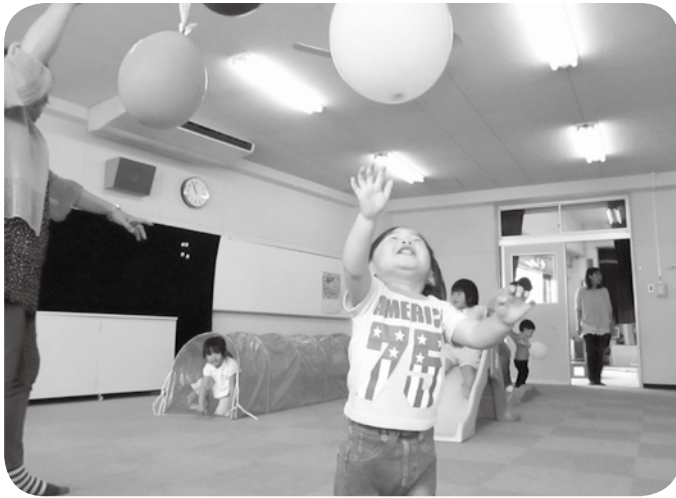
風船にジャンプ! トンネルくぐりもあるよ!!