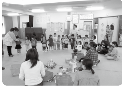
園児と一緒に触れ合い遊びを楽しみました 【5月10日 いびぎ保育園】

年齢が低い子どもは「片付け」の意味がわからない子もいます。「片付けましょう」ではなく「自動車はこの箱に入れてね」と片付け場所を具体的に伝えましょう。入れ物におもちゃの写真を貼って写真と同じ物を入れるマッチング遊びにしてもいいですね。遊びにすることで「片付けて楽しい」と思えます。子どもがしたがるらないことは、大人が手伝って「きれいになったね」と言って気持ちよさを共感しましょう。