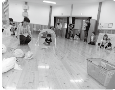
園児と一緒に触れ合い遊びを楽しみました 【6月28日たぐみ幼児園】

「目を合わせる」「話を聞く」という2つのことが一緒にできない子がいます。目を合わせることが怖かったり、目を合わせることに一所懸命で話を聞いていないということもよくあります。目が合わなくても話を聞いていればOKです。ただ、振り向いてほしいときは背後ではなく目の前に行って話しかけましょう。絵カードや実物を見せて視覚的にも示すと効果的です。無反応なのは、興味が無いものなのかもしれません。その子にとって本当に興味があるものは何なのかを大人が探ってあげましょう。