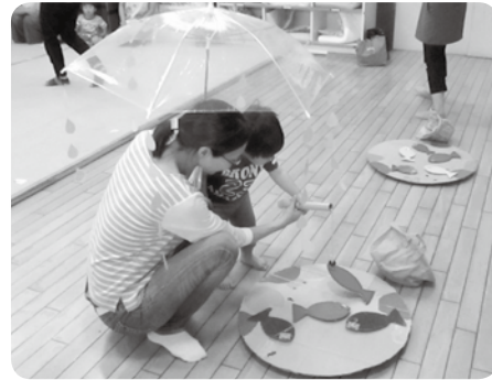
園児と一緒に触れ合い遊びを楽しみました 【6月14日養基保育園】