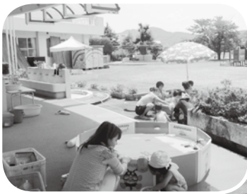
写真は 昨年度の様子