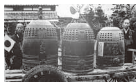
金属特別回収時の梵鐘供出