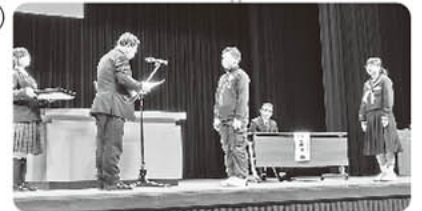
各種表彰の受賞者の皆さん、おめでとうございます。