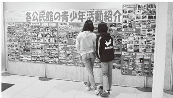
▲ロビーには各地区公民館・各小中学校PTAの活動パネルなどが展示されました。

青少年の健全な育成を願い、「平成29年度揖斐川町青少年育成町民大会」が11月25日（土）揖斐川町地域交流センター「はなもも」で開催されました。 揖斐高等学校の二人の生徒による司会で、当日は、各種表彰や青少年育成推進活動報告、小学生県外派遣（北海道芽室町・高知県宿毛市）の報告、中学生英語弁論大会発表、揖斐高等学校発表が行われました。また、各地区公民館活動、各小中学校PTA活動のパネルなどの展示、揖斐高ショップがあり、訪れた人の目を楽しませていました。