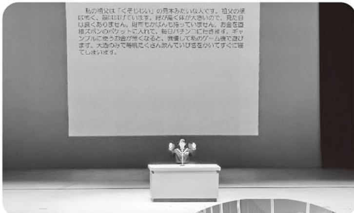
▲高円宮杯全日本中学校英語弁論大会出場者発表