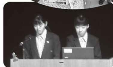
揖斐高生による岐阜県家庭クラブ連盟研究発表