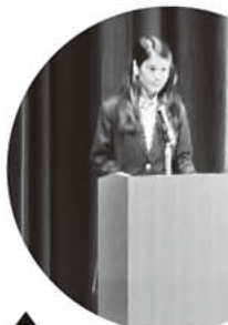
▲揖斐高生による 総司会 会場の様子▶