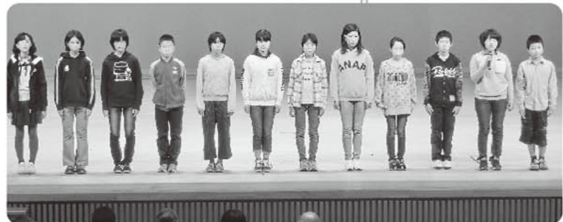
▲小学生県外派遣 (北海道芽室町)の報告