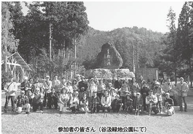
参加者の皆さん(谷汲緑地公園にて)

今後も、町民の皆さんに気軽にノルディック・ウォーキングを体験してもらえる機会を増やしていきます。