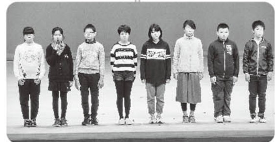
▲小学生県外派遣 (高知県宿毛市)の報告