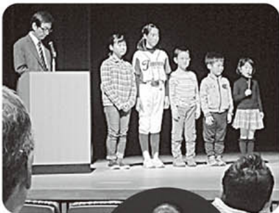
▲赤石地区の児童による取組発表