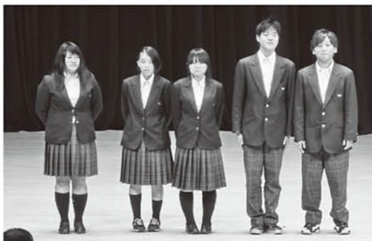
▲揖斐高生がボランティアとして大会運営に参加してくれました。