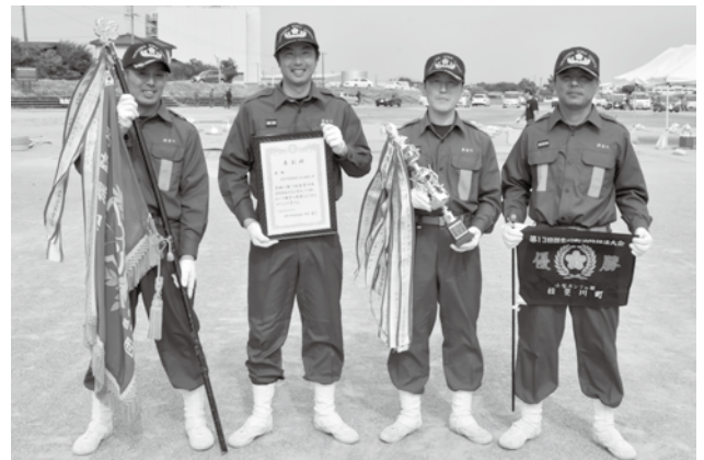
▲小型ポンプの部で優勝した大深分団第3班