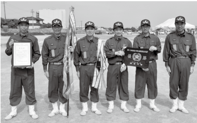
▲ポンプ車の部で優勝した名礼分団第1班