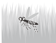
風通しの悪い やぶ・草むら

公園、学校、寺社、空海港、駅などの施設を管理されている方もご協力をお願いします!