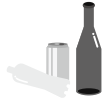
屋外に放置された空きビン・缶・ペットボトル