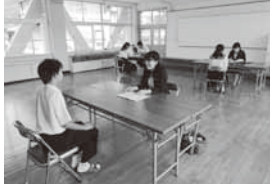
▲谷汲中学校での学習面談の様子

指導者は、揖斐高校の先生方です。面談は「失礼します。」という挨拶から始まり、生徒は家庭での学習ノートや「揖斐ベータシック(学習プリント)」を見せながら、取組の状況を説明します。指導者から、課題や今後の見通しなどを問われます。まるで面接試験のようです。最後に、生徒は、取組のよさをほめていただいたり、今後の進路や進学について助言をいただいたり、面接における礼法指導をしていただいたりしました。 このように、町では、揖斐高校と連携して、キャリア教育を充実させています。