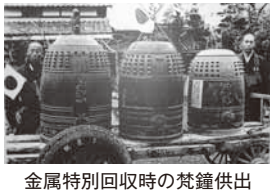
金属特別回収時の梵鐘供出