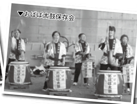
▼おぼば太鼓保存会