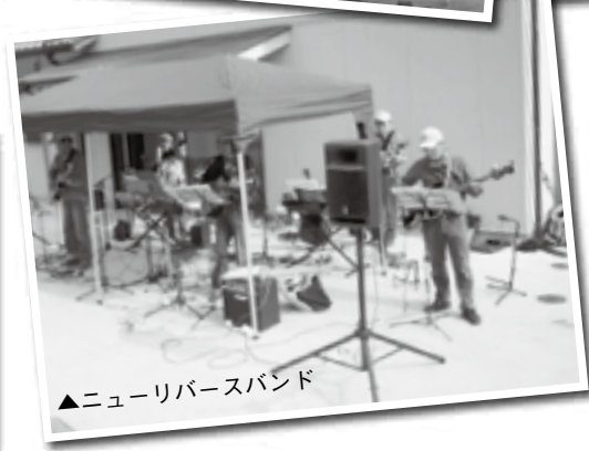
▲ニューリバースバンド