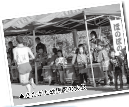
▲ぎたがた幼稚園の太鼓