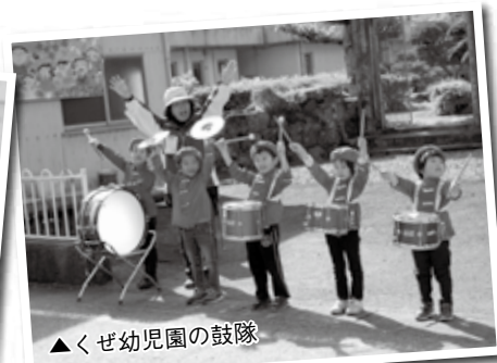
▲くぞ幼稚園の鼓隊