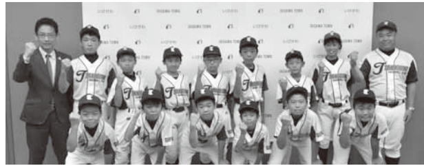
谷波野球 スポーツ少年団