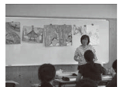
図工・美術実技研修