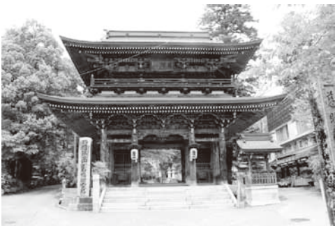
▲西国33番目 谷汲山華嚴寺