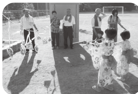
地域住民との交流