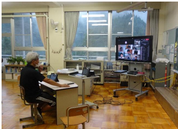
オンライン下校集会の様子

毎日、暑い日が続いています。熱中症指数が高いため、体育館でも遊べない日もありますが、2日には、久しぶりに運動場に出て、みんなで遊びました。