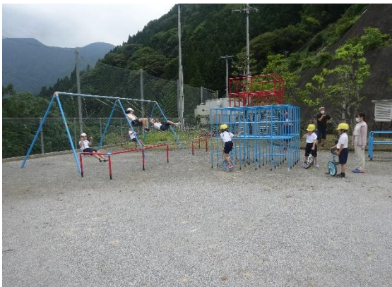
外で元気よく遊ぶ子どもたち