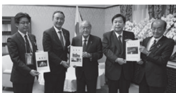
▲左から、佐々木鯖江市長、石田大垣市長、鈴木財務大臣、棚橋衆議院議員、岡部町長

冠山峠道路は、令和5年中に完成し、完成すると揖斐川町と福井県池田町間が50分短縮される見込みで、岐阜と日本海を結ぶ新たなルートとして、新たな産業・観光圏の創出や、物流による経済発展が期待されます。