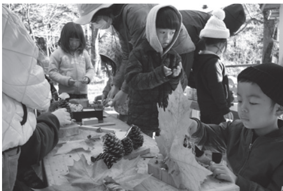
▲トンカチを使った自由工作の様子

「森のようちえん体験イベント」として開催されたこの行事では、森の中を散歩したり、たき火にあたったり、トンカチを使って工作したりと、町の豊かな自然を身近に感じることが出来ます。参加した子どもたちが、活発に森を駆け回り、思い思いに活動する様子が見られ、秋の寒さをも吹き飛ばす盛り上がりとなりました。