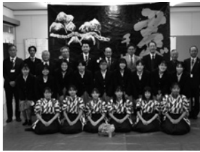
▶岐阜総合学園高校書道部合唱部と参加者の皆さん