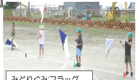
みどりぐみ: フラッグ