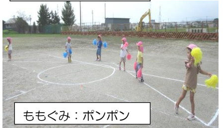
ももぐみ: ポンポン

あか組は、かけっこをしたり、バランス歩きをしたり、体を動かしながら楽しく運動遊びをしています。