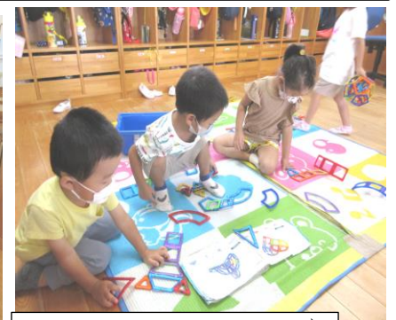
マグフォーマー(磁石ブロック)