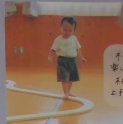
木製の板を並べると 楽しそうに歩いています。 板から落ちそうになると 上手くバランスをとっています★