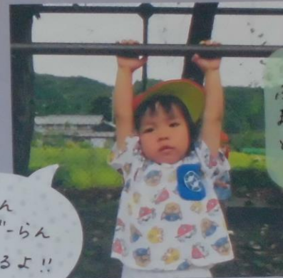
金床につかまり、 ぶらさがれるようになり ました★「せいせい、みて」 と、どの子も得意気に 見せてくれています★