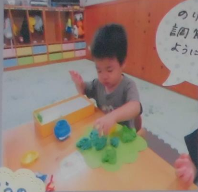
のりの量を 調節して、見占れる ようになって きました!