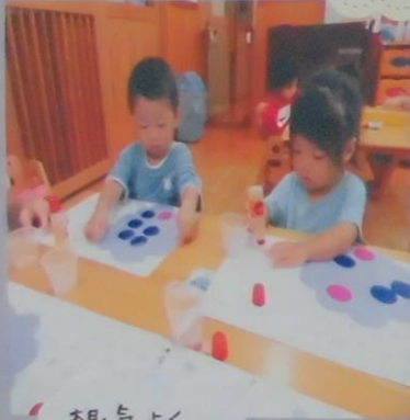
根気よく 最後まで やるこが できました