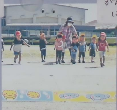
がんばらて はしるぞー!!