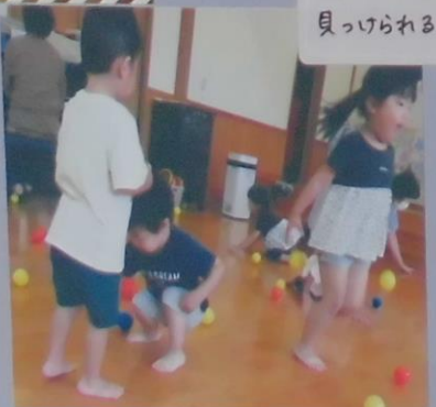
同じ色のボールを 見つけられるかな?