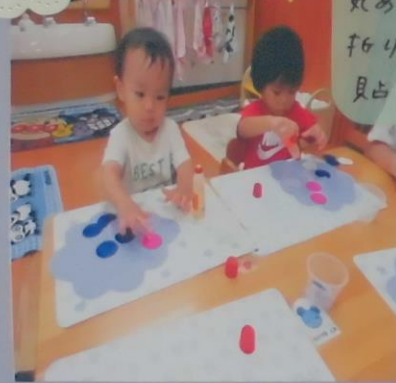
2枚は自分で花糸を 丸め、1枚は丸くカット して糸を、のりを使 って見占りました。