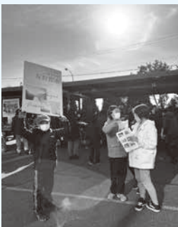
(芽室町魅力創造課 真田)

今回の物産販売を通して、多くの町民の方々が揖斐川町の商品を心待ちにしていることを改めて感じました。芽室町で常に揖斐川町の食材が手に入る仕組みを作り、もっと多くの方に揖斐川町の魅力をお届けできるようにしていきたいと思っております！