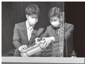
タイムカプセル開封