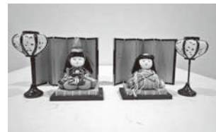
木目込みひな人形