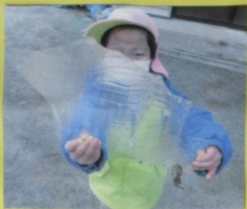
おおきい こおりを みつけたよ!!