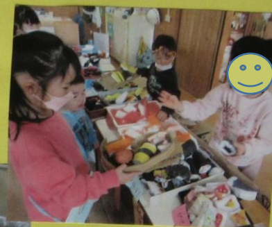
いらっしやいませ～ ありがとう ございました。