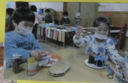
ともだちと いらっしやに たぐると おいしいね♡