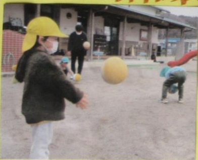
くぼおる たいけん> ぼおるも ついたり。たかくあげたり して。たのしが、たよ。