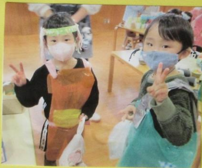
ふくやさんで コーディネート