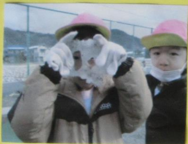
わなのあいた こおり!! わがねみたい