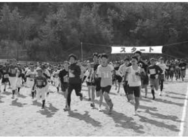
▲スタート直後の様子