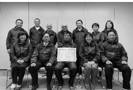
▲表彰を受けた揖斐川町スポーツ推進委員会の皆さん

揖斐川町スポーツ推進委員会では、昨年より春・夏・秋の定期でノルディック・ウォークの体験会を行っています。今年度の第1回目は4月16日(日)に開催しますので詳しくは広報3月号(前月号)をご覧ください、ぜひご参加ください。