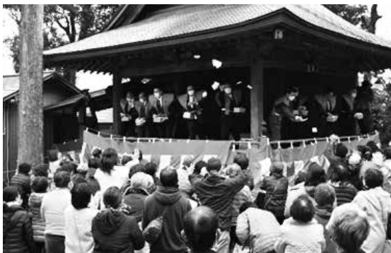
▲舞殿からの豆まきの様子

当たり付きの福豆袋をつかみ取った町内小学校の児童は「当たり付きをとれてうれしい。いい一年にしたい」と話しました。