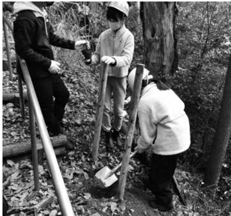
▶植樹を行う揖斐小学校6年生の皆さん

植樹を終えた児童は「自分が植えた木が大きくなるのが楽しみ。貴重な体験ができた」と話しました。