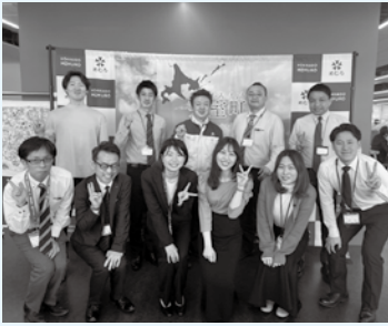
(芽室町魅力創造課 高橋)