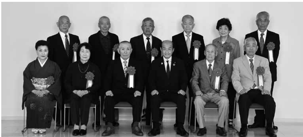
▲表彰状および感謝状受賞の皆さま