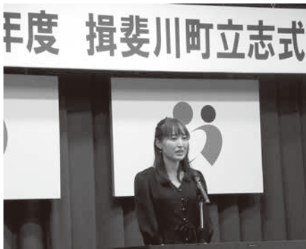
▲先輩からのメッセージ