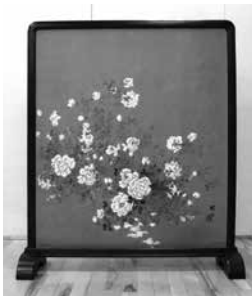
▲バラ衝立 (野原櫻州)

揖斐川歴史民俗資料館では、6月25日(日)まで館収蔵品の初公開作品を含む、絵画や書などを展示しています。お誘いあわせの上、ぜひご来館ください。