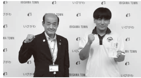
◆パロマカップ2023 第38回日本クラブユースサッカー選手権 (U-15) 大会 東海大会 出場