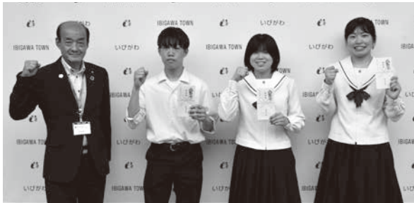
◆第70回東海高等学校総合体育大会 剣道競技 出場