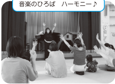
音楽のひろば ハーモニー♪