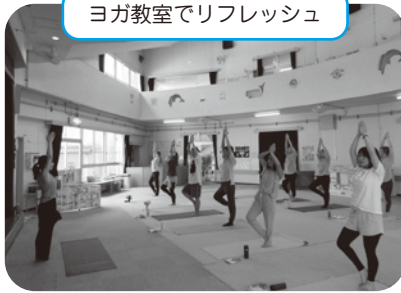
ヨガ教室でリフレッシュ