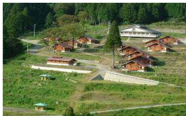
管理棟と天然温泉・菜園付コテージ、全12棟 (内、障害者用1棟)