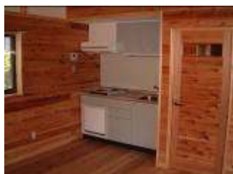
台所・ロフト・トイレ完備