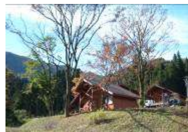
天然温泉・菜園付コテージ