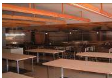
そば打ち・郷土料理体験コーナー