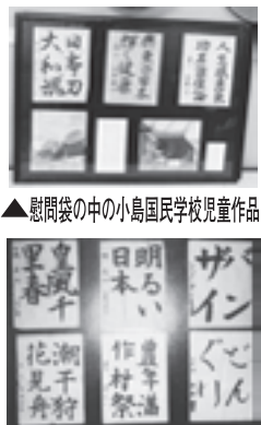
▲慰問袋の中の小島国民学校児童作品