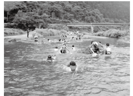
▲川遊び体験の様子

今回参加された、35人の皆さんが 学校・地域のリーダーとして活躍さ れることを期待しています。