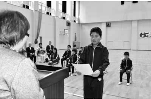
▲感謝状を受けとる児童