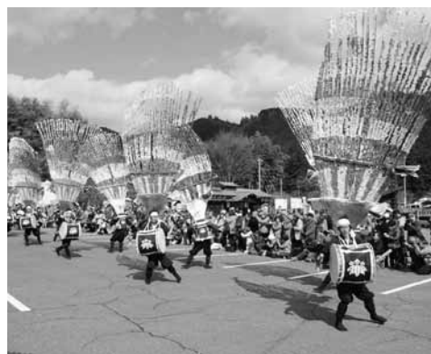
▲青空の下で奉納された谷汲踊

2月18日(土)、豊年祈願祭が谷汲山華厳寺一帯で行われ、多くの人々が訪れました。