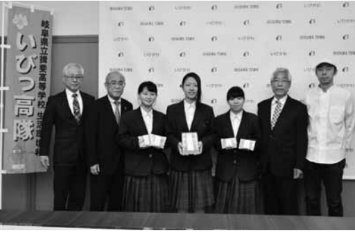
▲3種のクッキーを開発した生徒たち(中央3人)

生徒は、「先輩の活動を引き継ぎ、2年かけて試行錯誤したクッキーが商品化して嬉しい」と話しました。