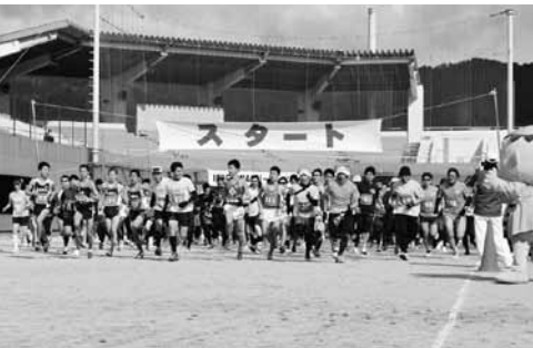
▲勢いよくスタート

またこの大会は、毎年10月に開催される岐阜清流流伝の選手選考大会にもなっているため、郡内のトップ選手の間でも年々増えています。今年も多くのエントリーがあり、さわやかな気候の中、颯爽と揖斐路を走るランナーには地元住民から温かい声援が送られ、全員がゴールしました。