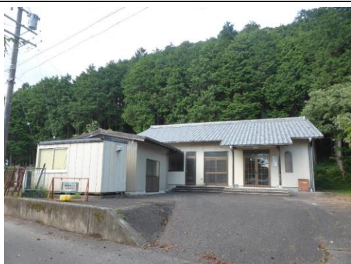
21_新田地区コミュニティ会館