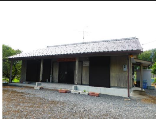
30_コミュニティプラザ山田