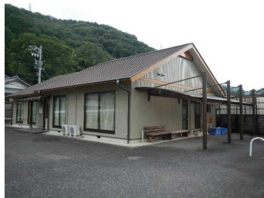
40_赤石地区集落農事集会所