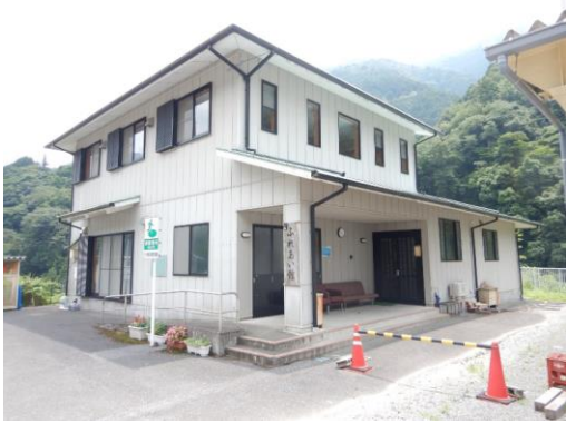
43_下ヶ流多目的集会施設