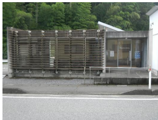
26_ふれあいコミュニティールーム