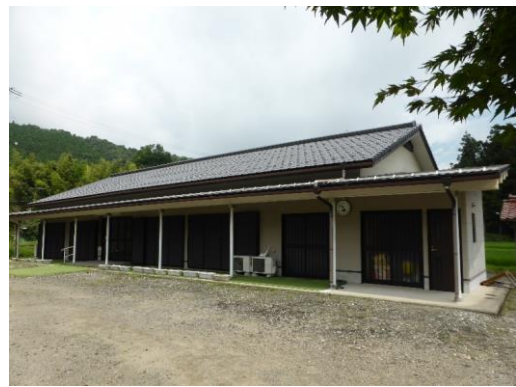
36_上長瀬地区コミュニティーセンター