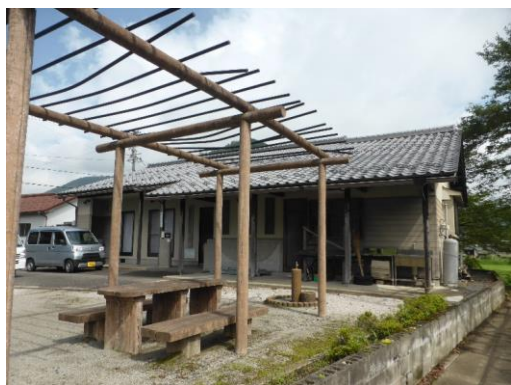
19_高科地区活性化支援センター