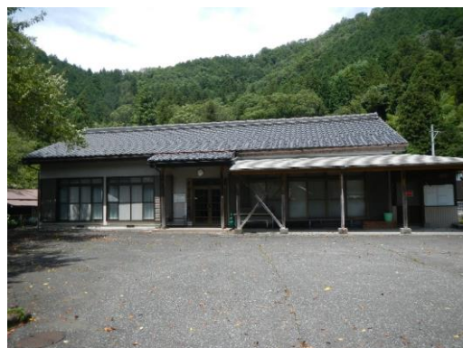
20_木曾屋地区活性化支援センター