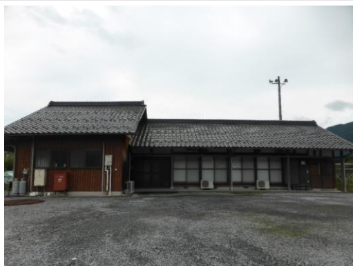
15_上野中部複合集会施設