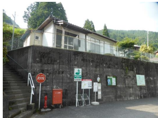
46_中山多目的集会施設