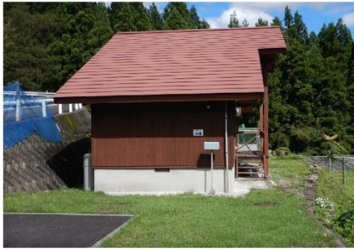
13-5_ワンダ農園_コテージ A棟