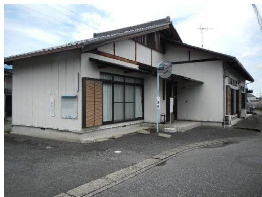
18_脛永東瀬古複合集会施設