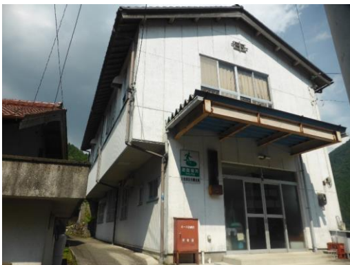
45_川合多目的集会施設