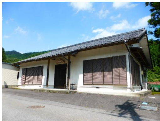
25_門前コミュニティ会館