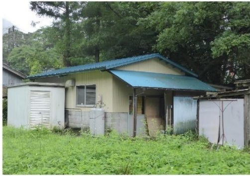
09_乙原特産品加工場_加工施設