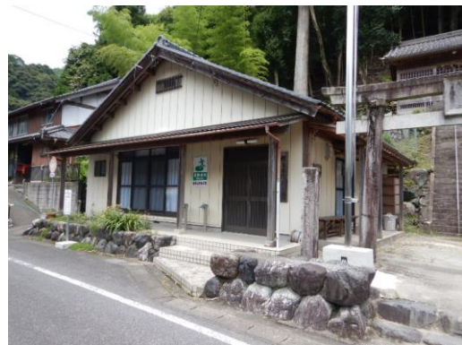
48_樫多目的集会施設