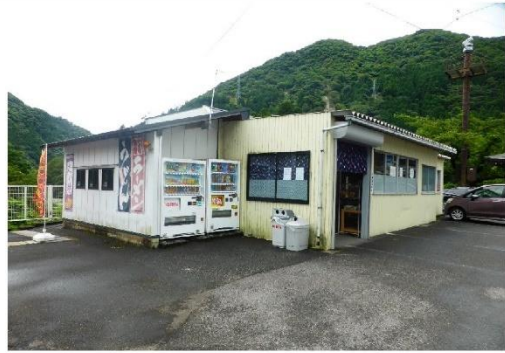
10_久瀬特産品販売所_販売所