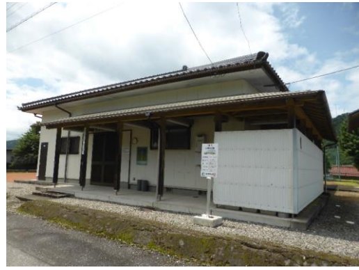
34_大洞地区農林漁家婦人活動施設