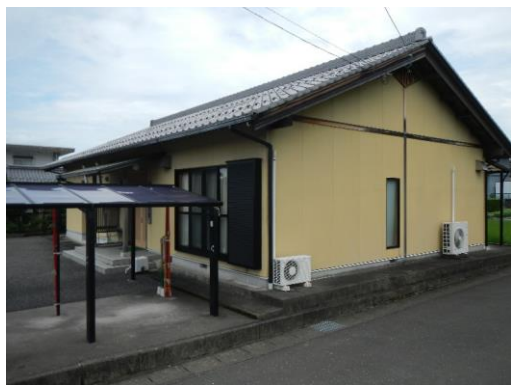
17_脛永中村複合集会施設