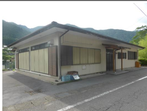
54_東横山多目的集会施設