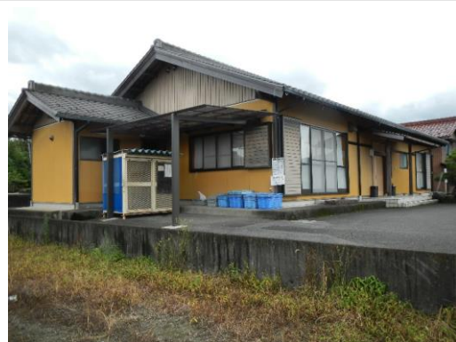
16_溝口複合集会施設