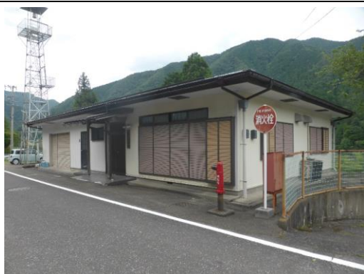
53_西横山多目的集会施設