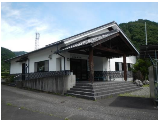
35_谷汲トレイルセンター