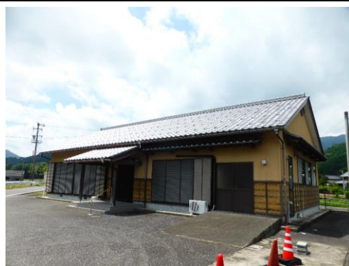
28_結城コミュニティセンター