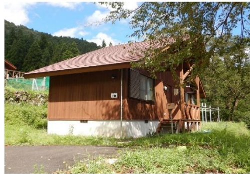
13-10_ワンダ農園_コテージ F棟