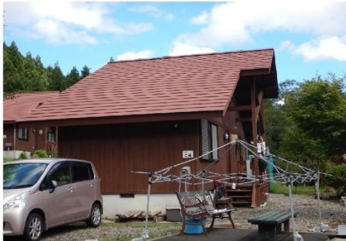
13-7_ワンダ農園_コテージ C棟