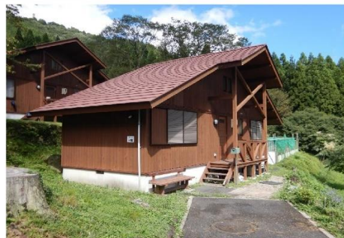
13-12_ワンダ農園_コテージ H棟