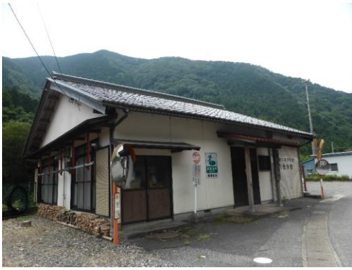
41_滝消防車庫兼集会施設