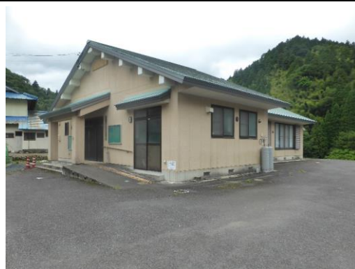
62_坂本コミュニティーセンター