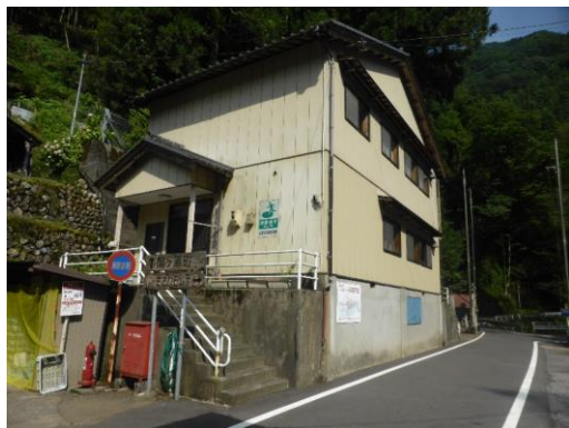
49_古屋多目的集会施設