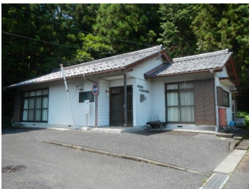
39_西村多目的集会施設