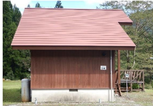
13-8_ワンダ農園_コテージ D棟