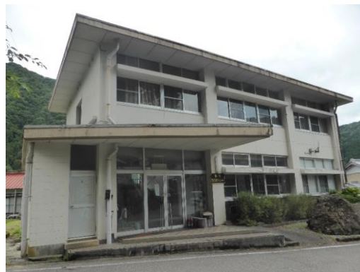
58_坂内生活改善センター