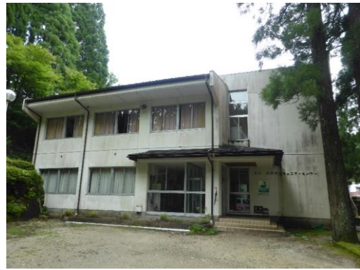
44_春日高齢者コミュニティセンター