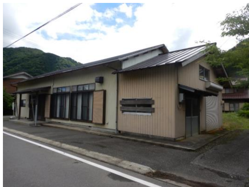
57_坂内コミュニティーセンター