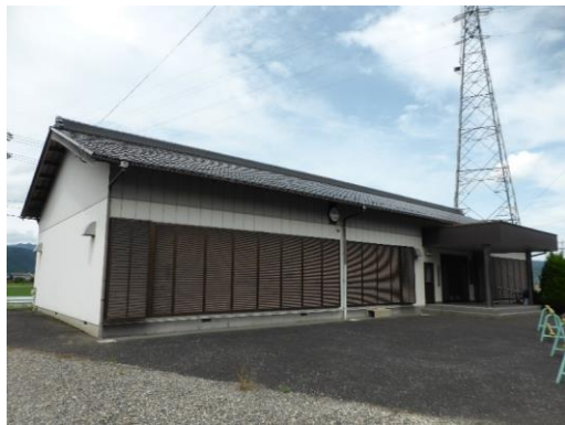
11_二の宮複合集会施設