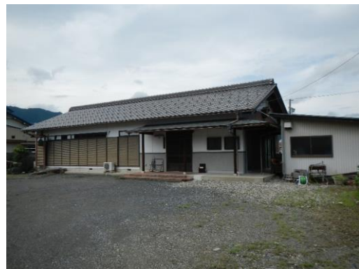
14_上東野複合集会施設