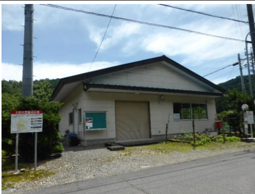
37_有鳥生活改善センター