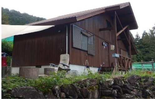
13-9_ワンダ農園_コテージ E棟