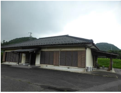
33_下長瀬地区活性化支援センター