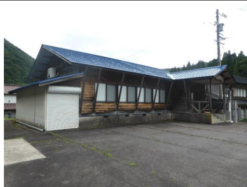
64_坂西多目的集会施設