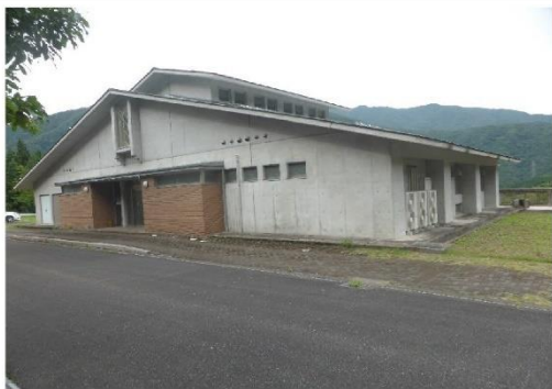
13-1_ワンダ農園(管理棟)