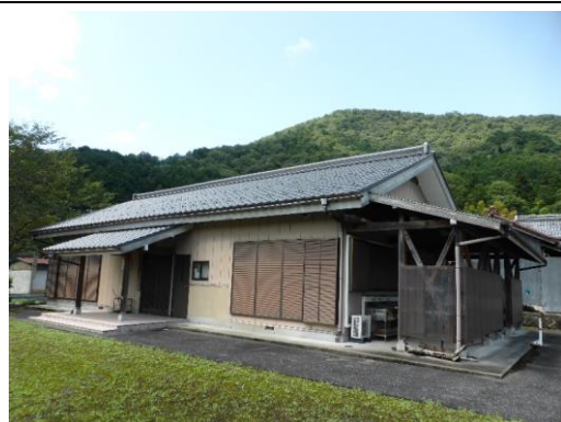
22_深根地区活性化支援センター