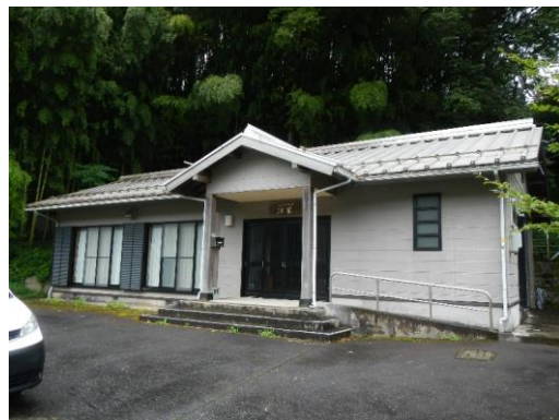
50_種本多目的集会施設