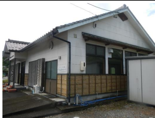
32_下名礼地区コミュニティーセンター