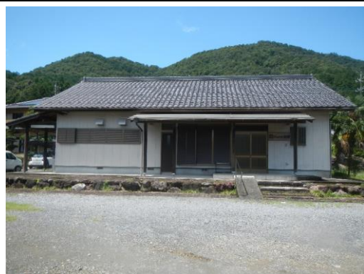
24_深坂中村コミュニティ会館