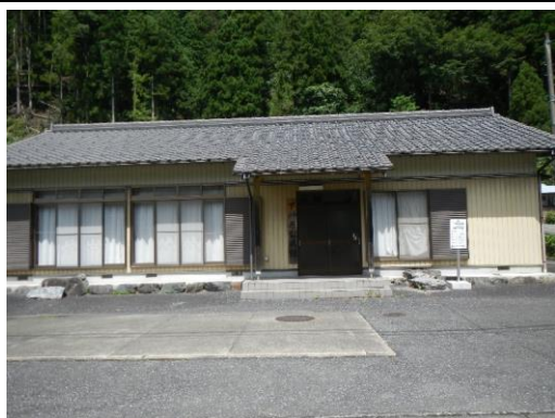
23_下神原地区コミュニティ会館