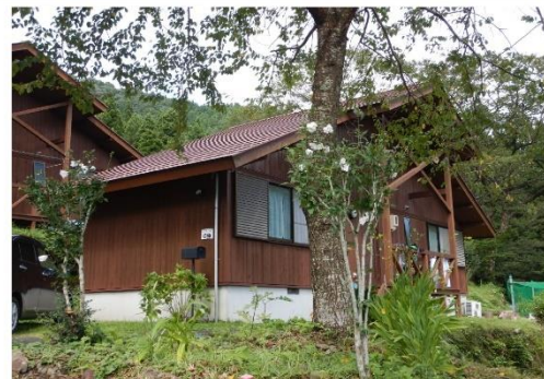
13-11_ワンダ農園_コテージ G棟