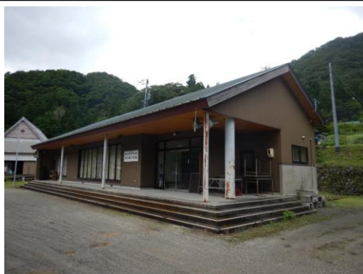
59_高齢者若者ふれあいの館