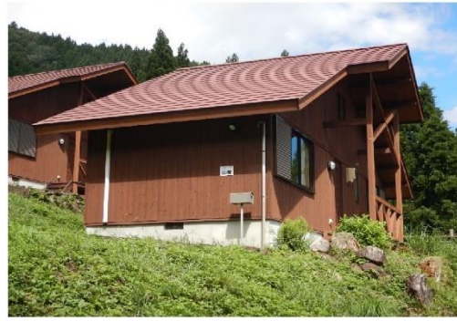
13-6_ワンダ農園_コテージ B棟