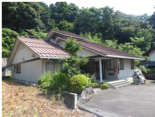
13_揖斐川地域研修センター