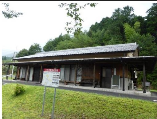
29_ふれあいプラザ上名礼