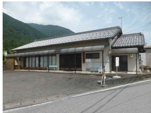
12_揖斐川町農事集会研修施設