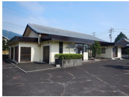
10_黒田複合集会施設