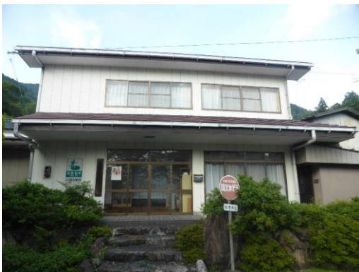
47_上ヶ流多目的集会施設