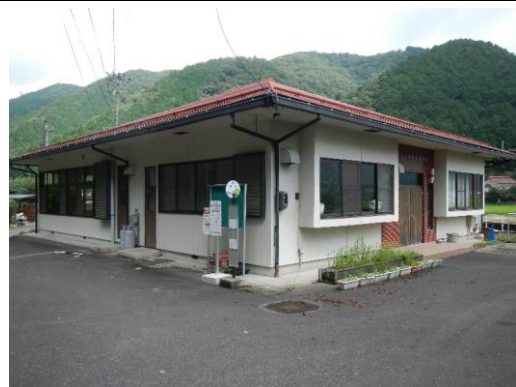
38_岐礼多目的集会施設