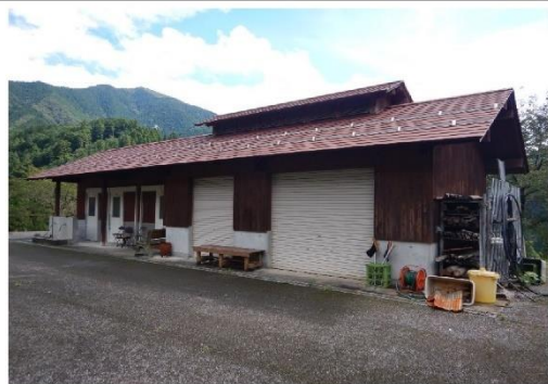
13-4_ワンダ農園_農作業倉庫