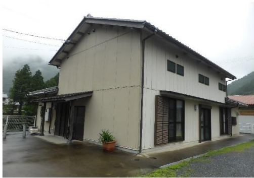
11_三倉特産品加工・文化伝承施設