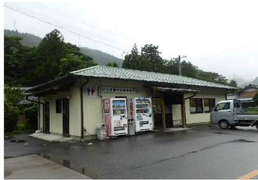
12_乙原農林水産物販売所