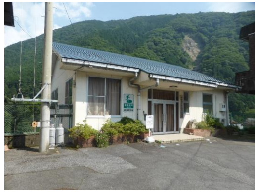
42_小宮神多目的集会施設