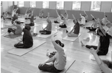
▲エンジョイ・スマイル教室