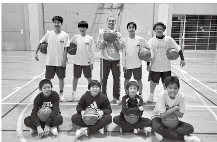
▲Jrバスケットボール