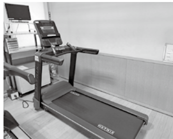
▲導入したトレッドミル