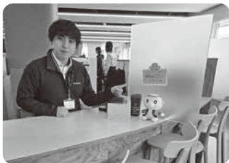
かっぱの河太郎を窓口に設置しました