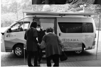
▲小津公民館での様子