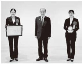
東海学院大学医療栄養学科