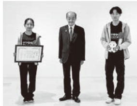
岐阜大学里山暮らし応援隊